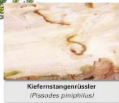
Kiefernstangenrüssler ( Pissodes piniphilus )