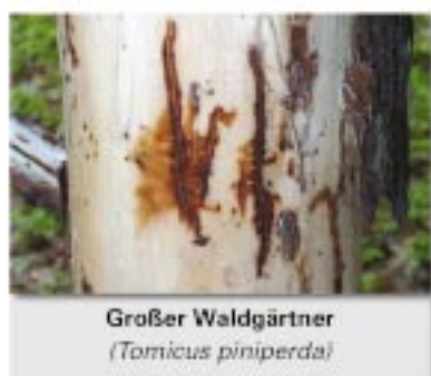
Großer Waldgärtner ( Tomicus piniperda )