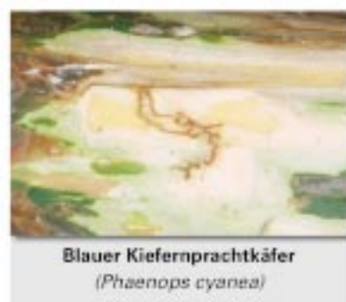
Blauer Kiefernprachtkäfer ( Phaenops cyanea )