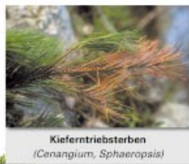
Kieferntriebsterben ( Cenangium, Sphaeropsis )