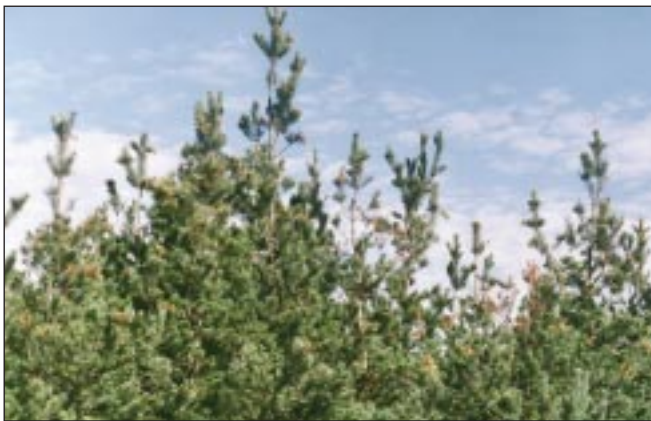
Durch Triebaushöhlungen des Waldgärtners verlichtete Kronen

Die Waldgärtner sind 3-4 mm lange Borkenkäfer ohne Zähne am Flügeldeckenabsturz und mit von oben sichtbarem Kopf. Die Käfer sind ausgesprochene Fröhschwärmer und beginnen mit ihrem Flug bereits im Februar/März. Der Kleine Waldgärtner besiedelt dünnrindigere Bereiche, der Muttergang wird als doppelarmiger Quergang angelegt (Klammergang) und schürft tief den Splint. Das Brutbild des Großen Waldgärtners besteht aus einem senkrecht verlaufenden Muttergang, an dessen unterem Ende die Rammelkammer angelegt ist. Dadurch ähnelt das Brutbild etwas einem Golfschläger. Nach Fertigstellung des Brutbildes fliegen viele Altkäfer 5 bis 8 Wochen nach der Einbohrung zum Regenerationsfraß in die Kronen von stehenden Kiefern, um danach nochmals eine Brut anzulegen. Während des Regenerationsfraßes höhlen die Käfer gesunde Triebe aus, die besonders bei starkem Wind zu Boden fallen. Diese „Zweigabsprünge“ findet man oft zu Hauf am Waldboden, die Kiefernkronen verlichten durch den Triebverlust und wirken zerzaust (= „Waldgärtner“). Die im Juni/Juli fertig entwickelten Jungkäfer vollziehen ihren Reifungsfraß triebaushöhlend wie die Altkäfer bis weit in den September hinein. Der damit verbundene Nadel- und somit Assimilationsverlust schwächt die Kiefern primär.