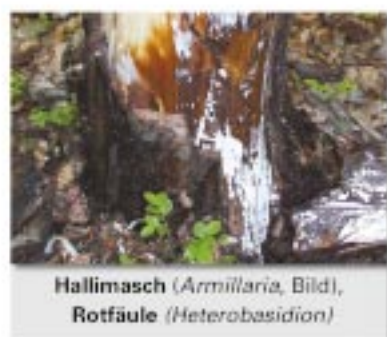
Hallimasch ( Armillaria , Bild), Rotfäule ( Heterobasidion )