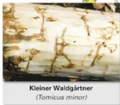
Kleiner Waldgärtner ( Tomicus minor )

weitere Kiefernborkekäfer ( Pitogenes sp. )