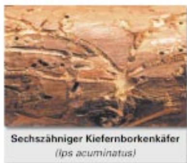
Sechszähliger Kiefernborkekäfer ( Ips acuminatus )