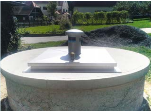
So schon! Edelstahldeckel; Brunnenschacht mindestens 30 cm über das Gelände hochgeführt