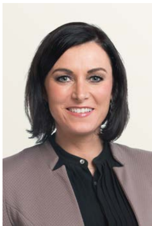
Elisabeth Köstinger Bundesministerin für Nachhaltigkeit und Tourismus

Der heutige Waldreichtum Österreichs ist einer brillanten Idee und deren konsequenter Verfolgung und Verwirklichung über Jahrzehnte, ja Jahrhunderte hinweg geschuldet. Das Konzept „Nachhaltigkeit“ wurde von Menschen entwickelt, die den Wald erhalten wollten, und kann in Mitteleuropa auf eine 300-jährige Geschichte zurückblicken.