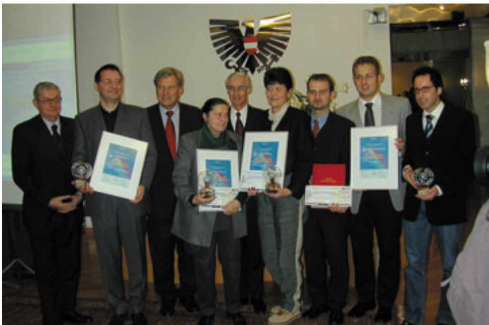
Die Agenda 21-Preisträger bekamen Geldpreise, Urkunden und Kunstobjekte aus der „Blaue Mühle“