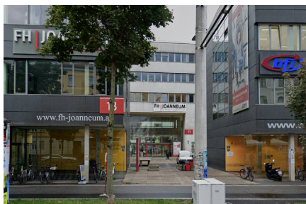
Von der Haltestelle „ Fachhochschule Joanneum “ zum Audimax

Mit dem QR-Code direkt zur ÖVM- Routenplanung!