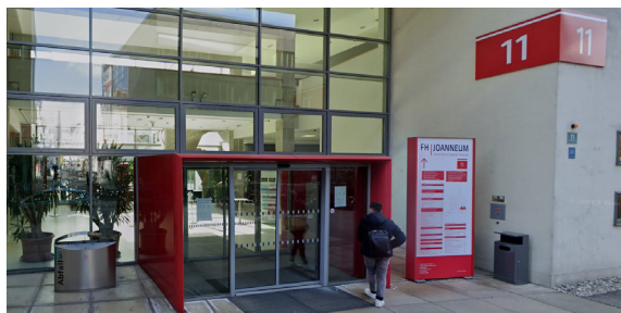
Eingang zum Audimax der FH JOANNEUM Graz