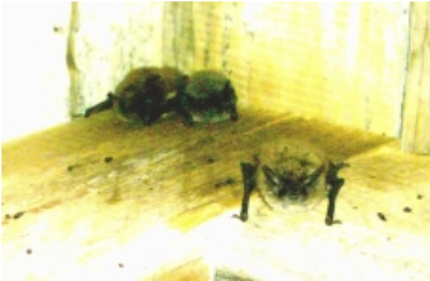
Abb. 5: Ein Teil der im Dachboden eines Einfamilienhauses entdeckten Wochenstube der Bart-/Nymphenfledermäuse ( Myotis brandtii/mystacinus/alcaethoe ) im Natura 2000-Gebiet.