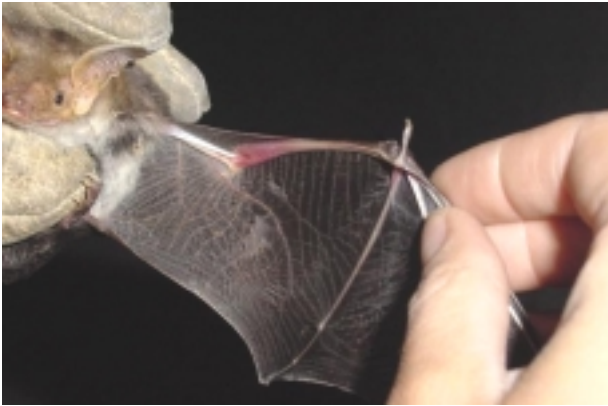
Abb. 4: Das Große Mausohr ( Myotis myotis ) zählt zu den größten heimischen Fledermausarten.

Beide Mausohr-Fledermäuse sind im Anhang II der FFH-Richtlinie aufgelistet (ANONYMUS 1992). In den Roten Listen ist das Große Mausohr als „gefährdet“ eingestuft, das Kleine Mausohr als „vom Aussterben bedroht“ (BAUER & SPITZENBERGER 1994).