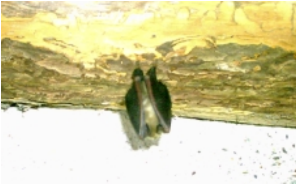
Abb. 2: Kärnten und die Steiermark stellen für die Kleinen Hufeisennasen ( Rhinolophus hipposideros ) den Verbreitungsschwerpunkt der Sommerquartiere in Österreich dar.

In den Roten Listen gefährdeter Tiere Österreichs wird die Kleine Hufeisennase als „gefährdet“ klassifiziert (BAUER & SPITZENBERGER 1994) und sie ist in der FFH-Richtlinie im Anhang II aufgelistet (ANONYMUS 1992).