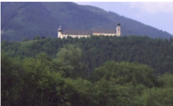
Abb. 6: Die nicht mehr im Natura 2000-Gebiet gelegene Kirche Frauenberg und das bevorzugte Jagdhabitat Kleiner Hufeisennasen ( Rhinolophus hipposideros ) – Wald. Auch andere Fledermausarten jagen vorwiegend im Wald, so z.B. auch Mausohren ( Myotis myotis/blythii ), welche am 2.8.2004 mittels Detektor in diesem südlich der Kirche gelegenen Waldstück nachgewiesen wurden.

Weiters gelten die langsam fließende Bereiche der Enns bzw. anderer Fließgewässer inkl. deren Ufervegetation, vor allem aber sämtliche stehende Gewässer, sofern sie nicht durch Schwimmpflanzen oder dergleichen bedeckt sind, als wichtige Jagdgebiete für viele Fledermausarten, insbesondere für die Wasserfledermaus ( Myotis daubentonii ), die Zwergfledermaus ( Pipistrellus pipistrellus ) und die Kleine Bartfledermaus ( Myotis mystacinus ) (Abb. 7). (RYDELL et al. 1994, ZAHN & MAIER 1997)