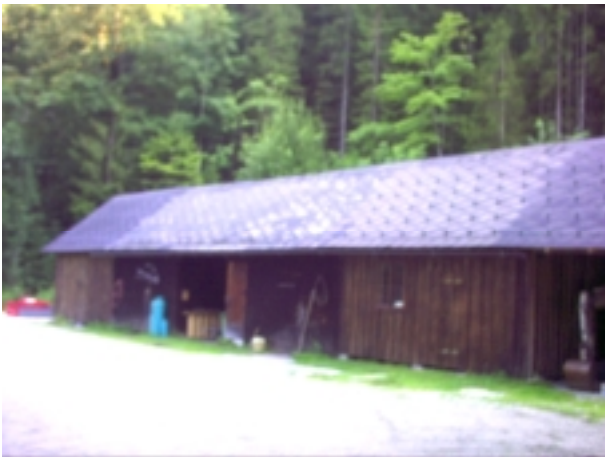
Abb. 3: Dieser Geräteschuppen am Rande des Natura 2000-Gebietes (Straße ist Grenze) beherbergt zeitweise drei verschiedene Fledermausarten, das verraten Guanofunde der Kleinen Hufeisennase ( Rhinolophus hipposideros ), von Langohren ( Plecotus sp.) und Mausohren ( Myotis myotis/blythii ).

Die Detektorkontrollen konnten für die Kleine Hufeisennase keinen Nachweis erbringen, es handelt sich bei den Rufen dieser Art um sehr hochfrequente Rufe, die im Detektor nur über eine geringe Entfernung hörbar sind. Eine Ausflugsbeobachtung bei der Kirche Frauenberg zeigte, dass die Tiere sowohl nach Süden als auch nach Norden abflogen, wo genau die Fledermäuse jagen konnte aber nicht eruiert werden.