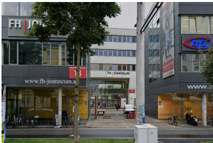
Von der Haltestelle „ Fachhochschule Joanneum “ zum Audimax

Mit dem QR-Code direkt zur ÖVM- Routenplanung!