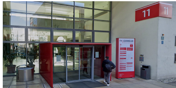
Eingang zum Audimax der FH JOANNEUM Graz